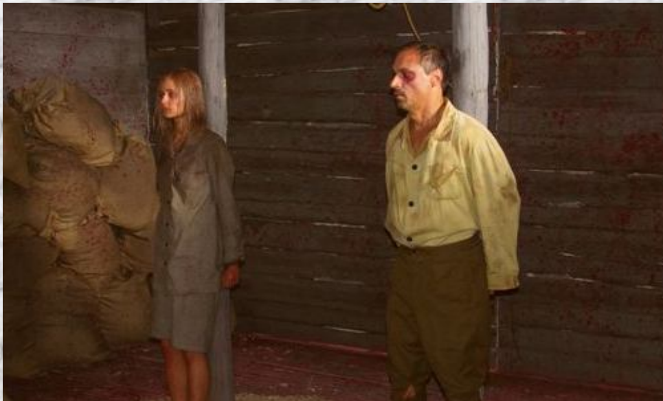
ZS w Gołąbkach