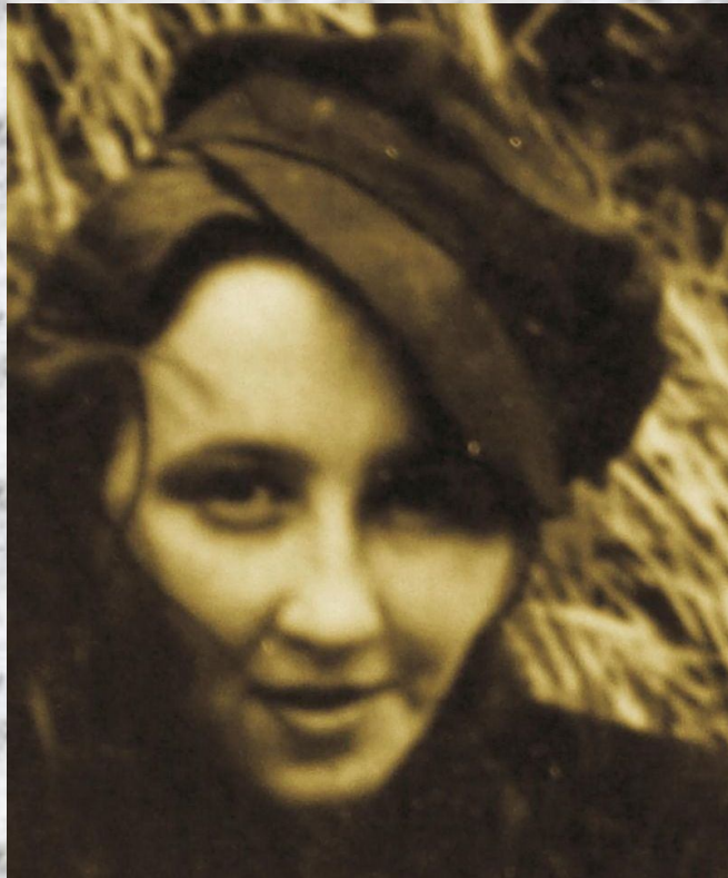
ZS w Gołębkach