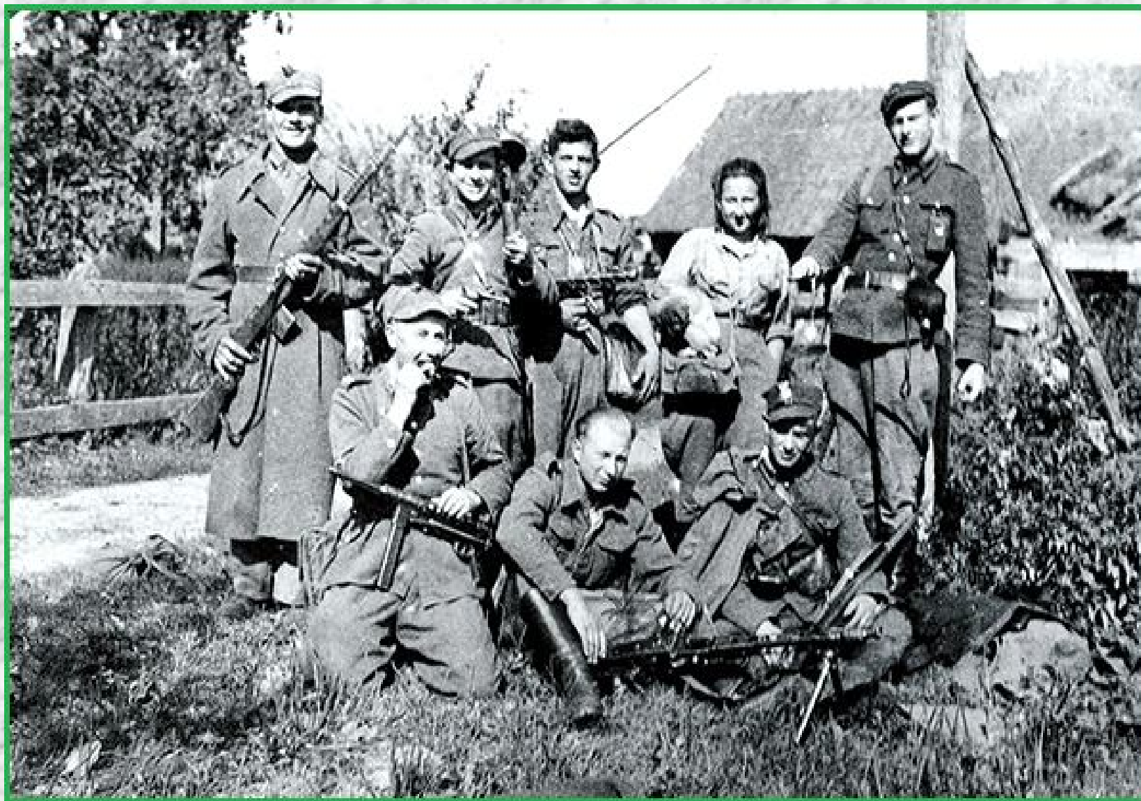
ZS w Gołębkach