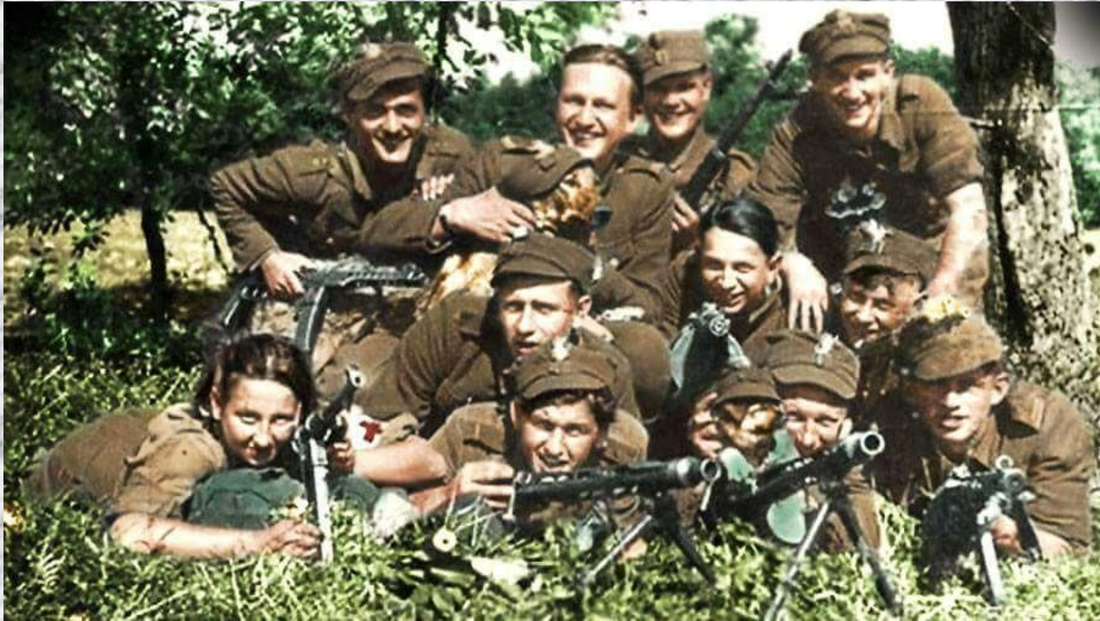
ZS w Gołąbkach