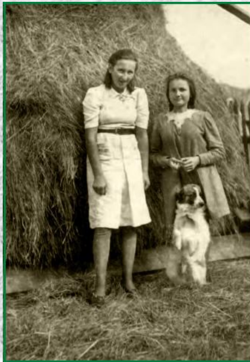
ZS w Gołąbkach