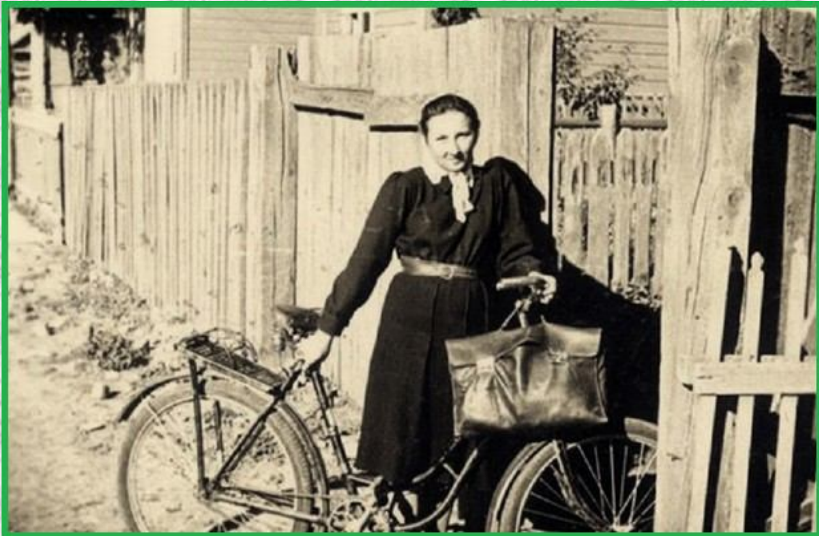
ZS w Gołąbkach